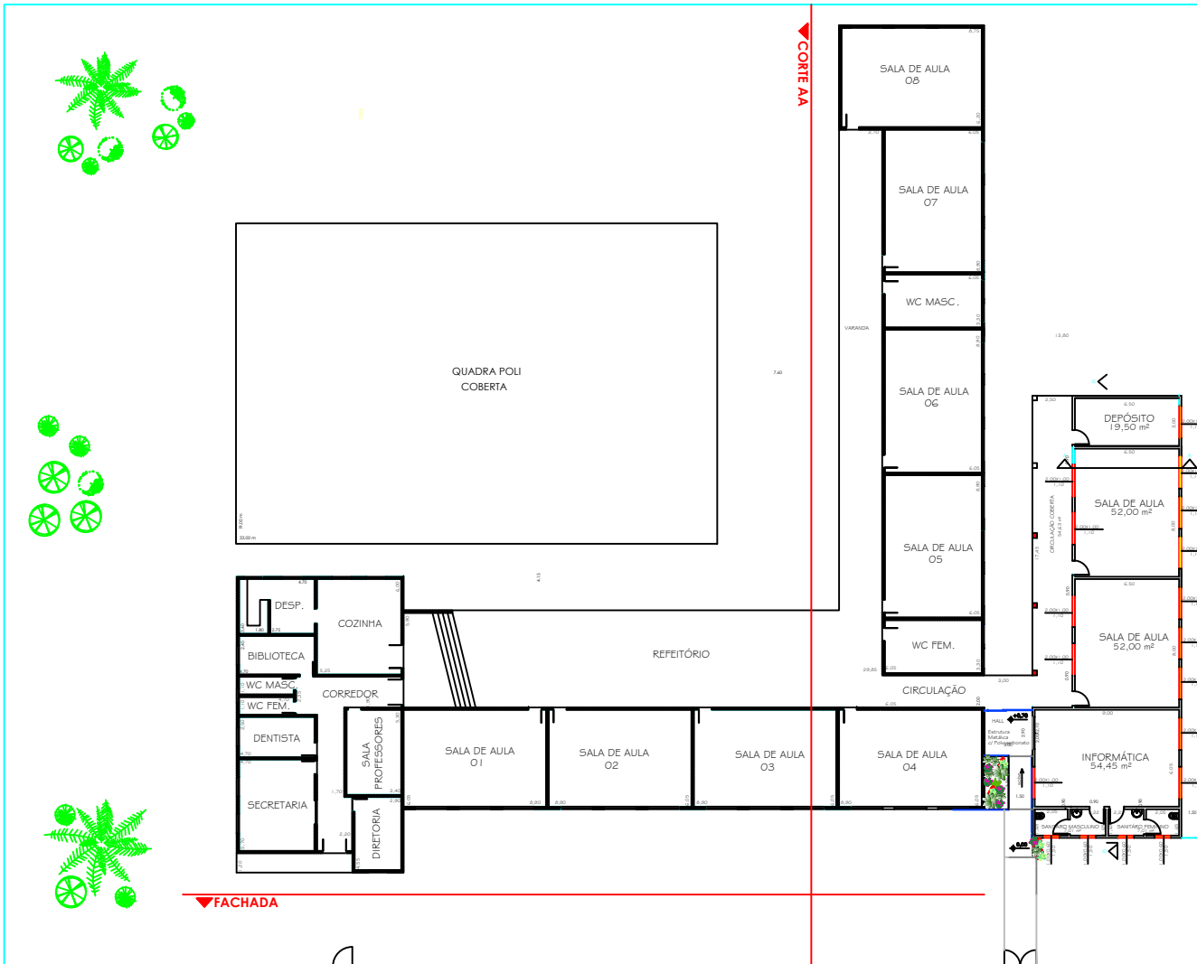
PLANTA BAIXA - ESCALA 1 : 100